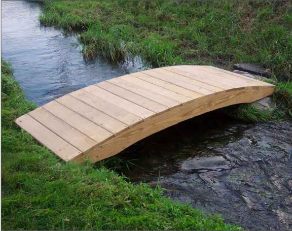
Drevené premostenie rýgolu a dažďového záhonu